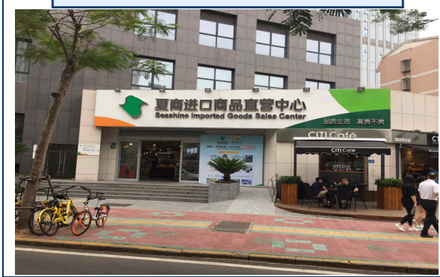
사상 수입상품직영센터 전경