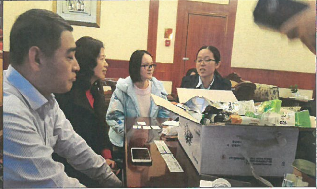
시 투자통상분야 직원과 기념촬영