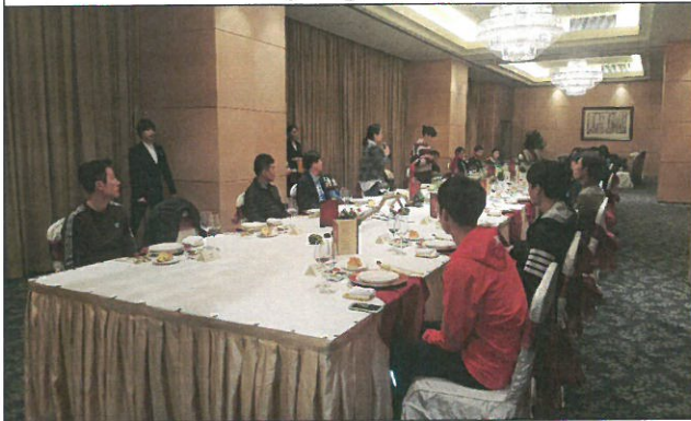
시 외사교무판공실 간담회