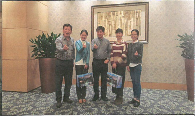
시 외사교무판공실 간담회