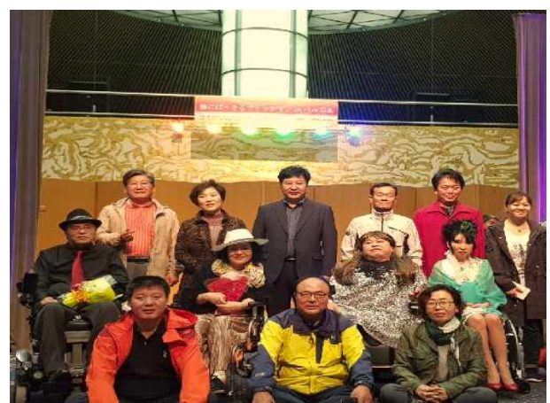
패션쇼 참가자들과 함께