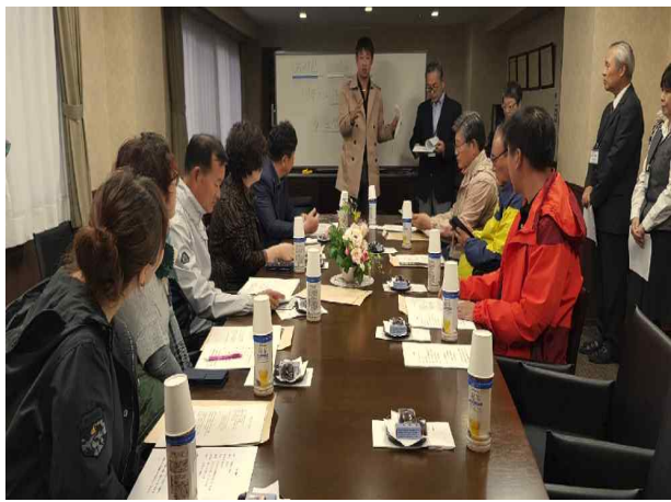
시설 현황 청취