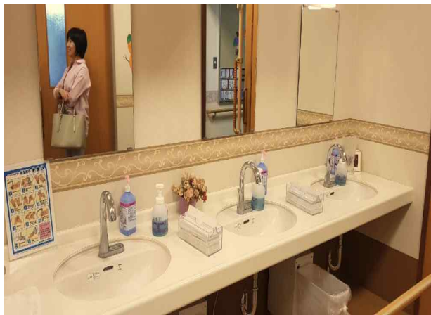
식당 입구 손 씻는 공간