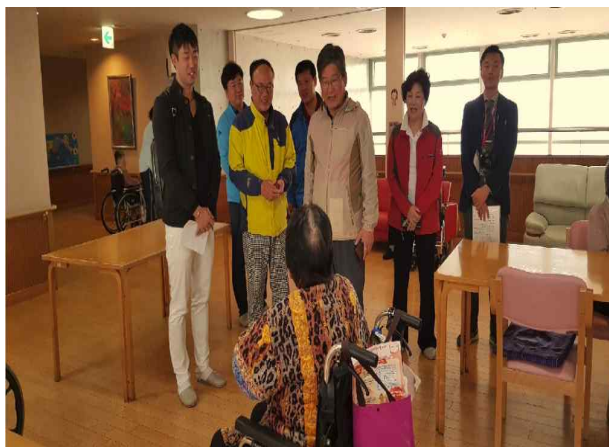
재일동포 어르신과의 만남