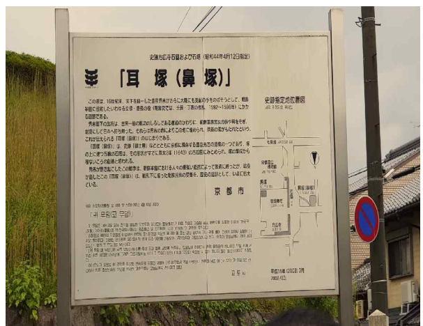
귀무덤에서 알게된 슬픈 우리의 역사