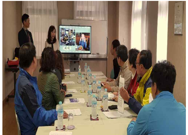
시설 현황 청취