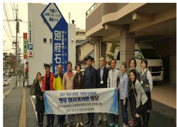
이시가키엔 직원들과 기념사진