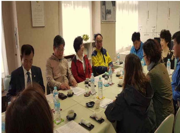
시설 관계자들과의 간담회