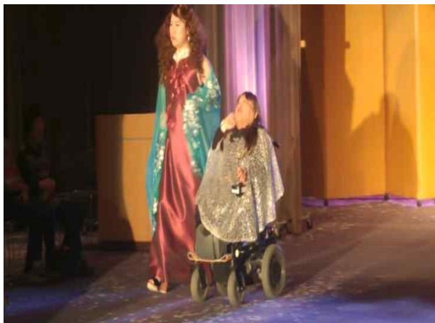
베틀시장님의 화려한 변신