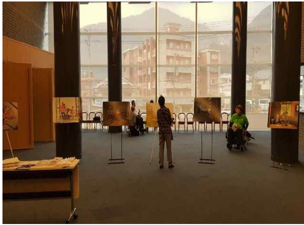
장애인 패션사진 전시