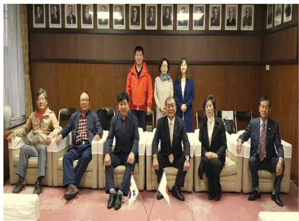
의장님과 기념 사진