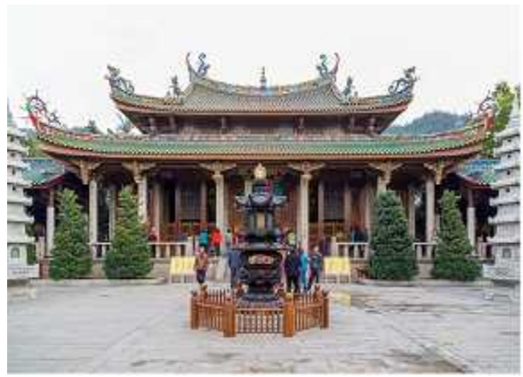
<중국 샤먼-남보타사 대웅전>