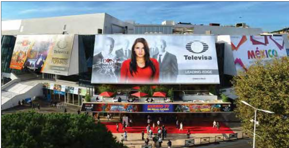
【2015 MIPCOM 행사장 전경】