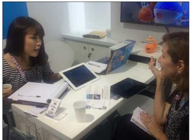
【“참참참”을 해외바이어에게 소개하는 (주)레드로버 해외영업부 직원】