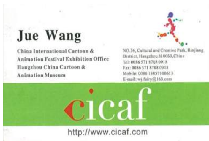
【현지미팅 업체 명함】