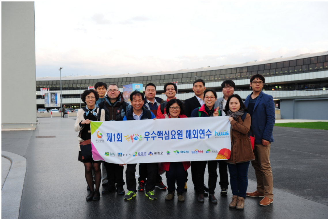
↑ 오스트리아 빈 공항 도착