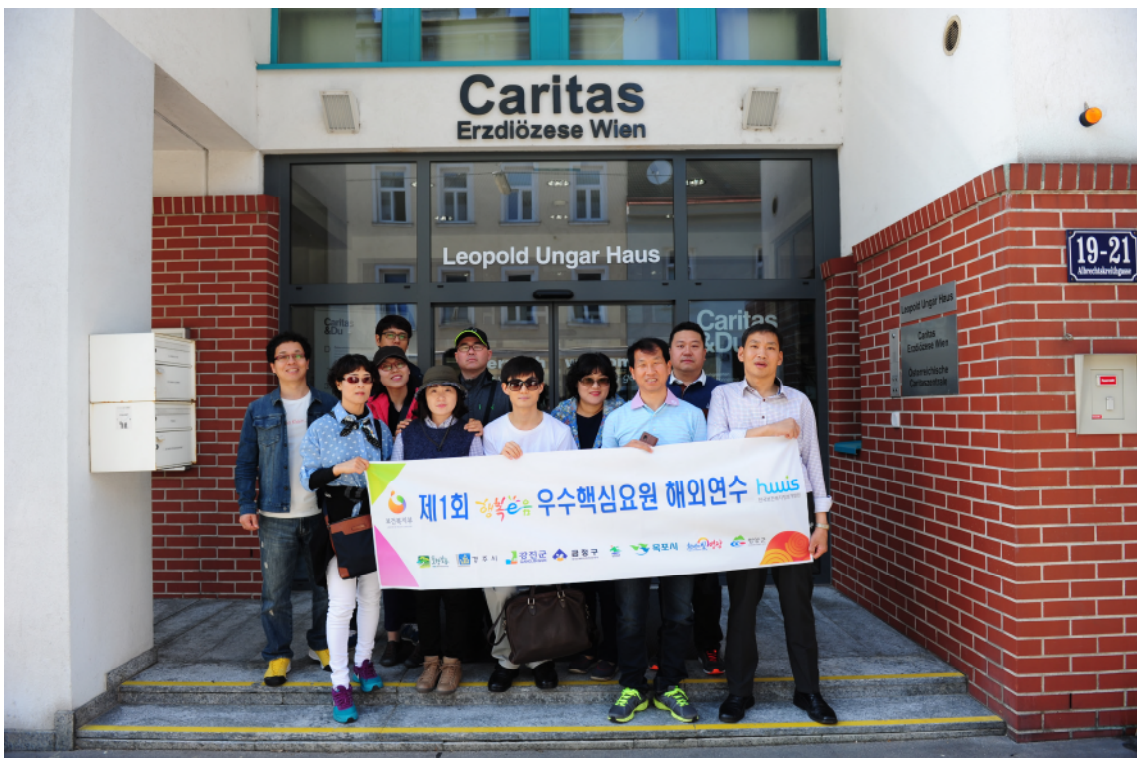
↑ 카리타스 빈 기관방문