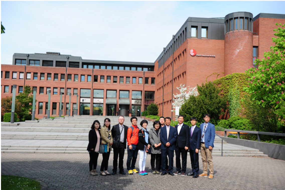
↑ 호펜하임노동사회복지사무소 기관방문