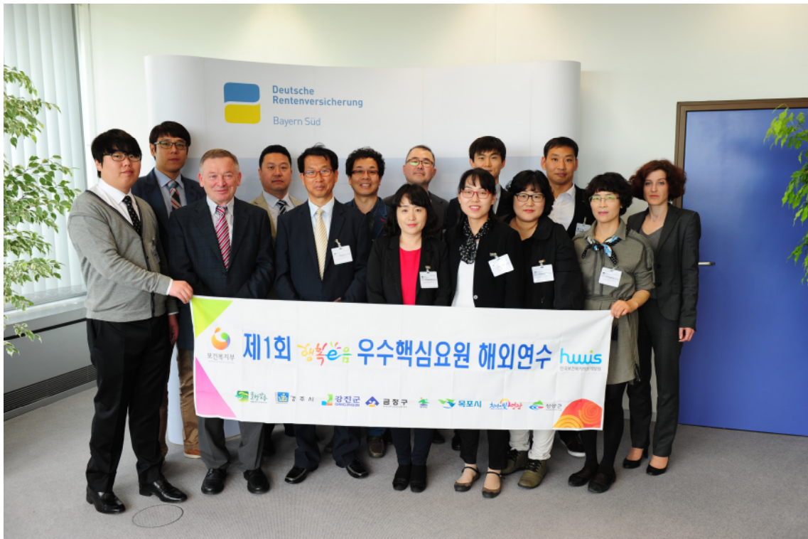
↑ 독일연금공단 뮌헨지부 기관방문