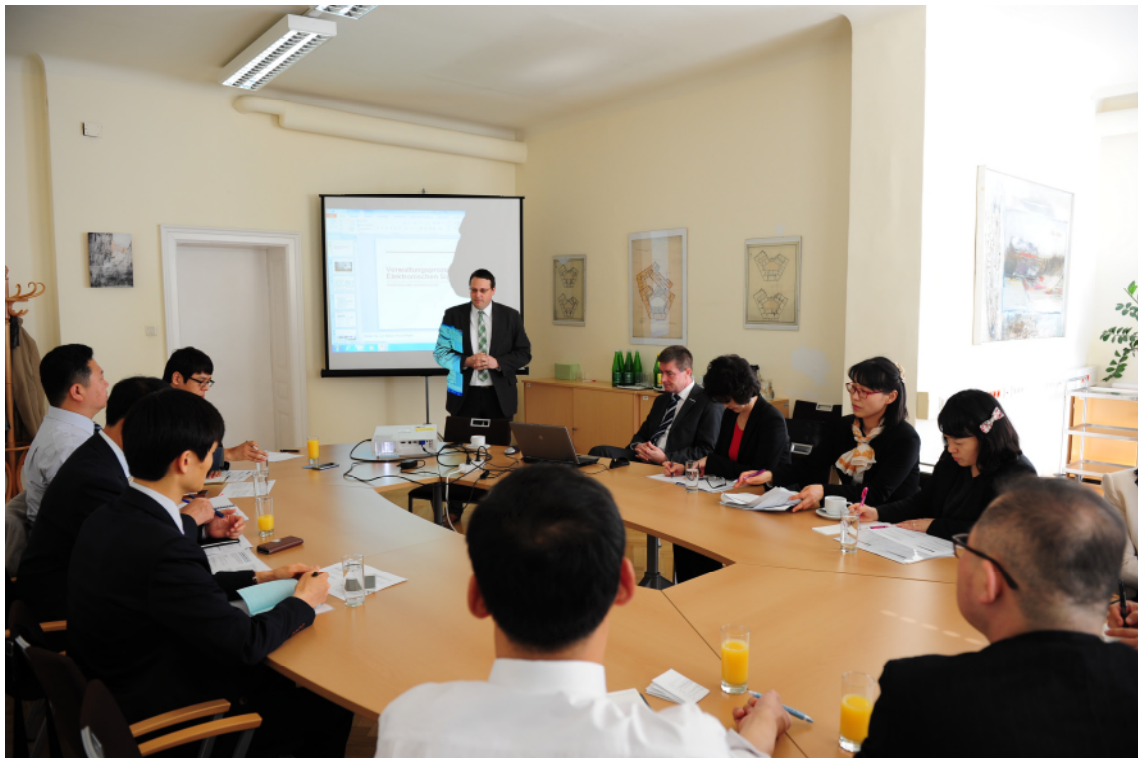
↑ 오스트리아연방 전자정부추진단 기관방문