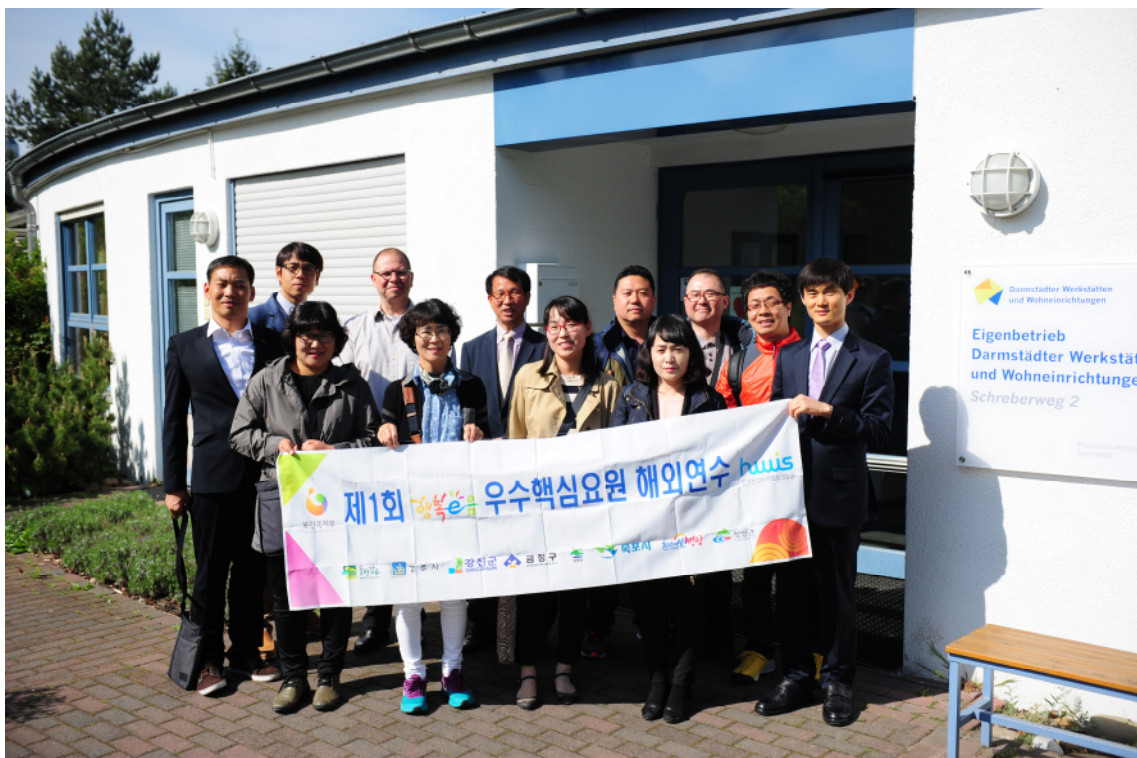
↑ 하이델베르크장애인보호작업소 기관방문