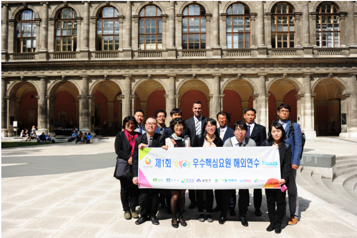
↑ 오스트리아 사회보장연합회 기관방문