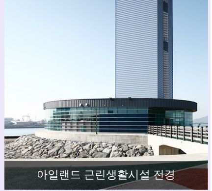
아일랜드 그린생활시설 전경

COPYRIGHT © MOKPO-SI. ALL RIGHT RESERVED.