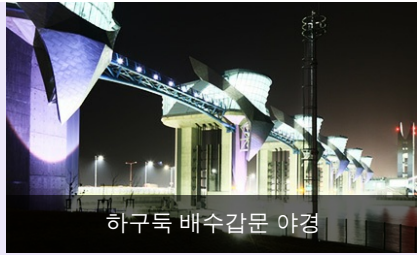
하구둑 배수갑문 야경