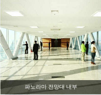
파노라마 전망대 내부