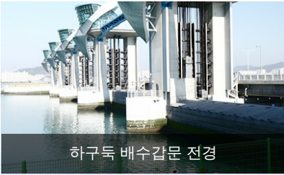
하구둑 배수갑문 전경